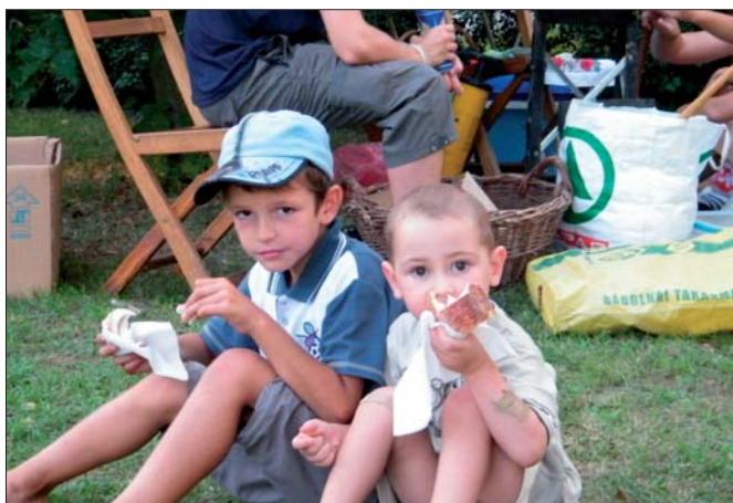
Ez a kürtös kalács volt a legfinomabb