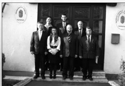
A 2010–2014 ciklus képviselő-testülete

Papkeszi Községi Önkormányzat képviselő-testülete október 13-án, szerdán tartotta ünnepi testületi ülését, amelyen a polgármester és a képviselő-testületi tagok esküt tettek.