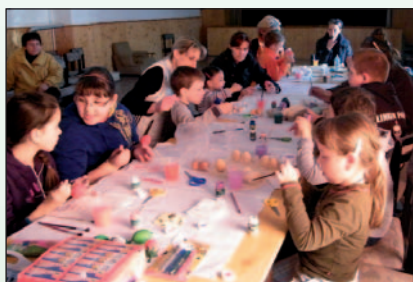
Lázás munka a húsvétváro játszóházban

A Kultúrházak éves munkaterve szerint április 8-ra tervezett húsvétváro játszóház Colorchemia lakótelepen elmaradt a felújítási munkálatok miatt. Papkeszin azonban április 9-én megrendezésre került. A nem kevés számú érdeklődők, gyermekek és anyukák a közelgő húsvéti ünnepkörnek megfelelően különféle technikákkal, és többféle anyagból készült festett, díszített tojásokat készíthettek.